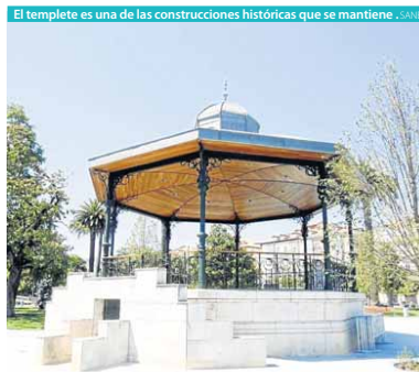
El templete es una de las construcciones históricas que se mantiene. SANE