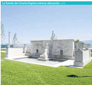
La fuente de Concha Espina estrena ubicación. SANE