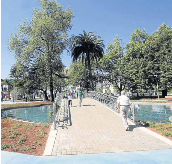
El color azul de la bahía se traslada hasta el interior de los jardines y el fondo del estanque. SANE

ESPECIALISTAS EN ILUMINACIÓN, CONTROL Y DOMÓTICA