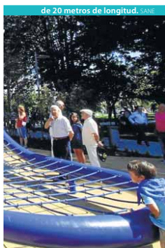
de 20 metros de longitud. SANE